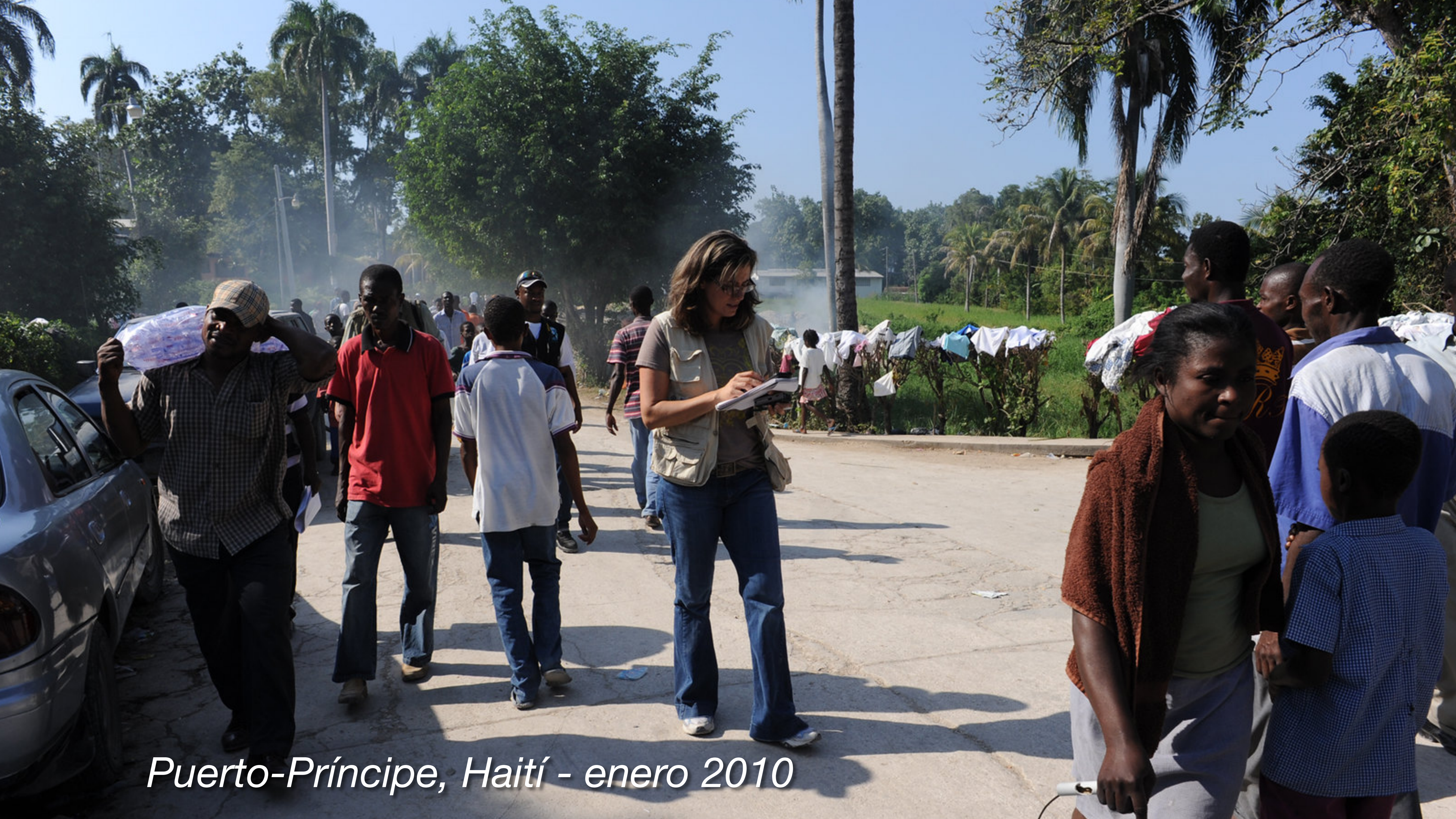
Puerto-Príncipe, Haití - enero 2010