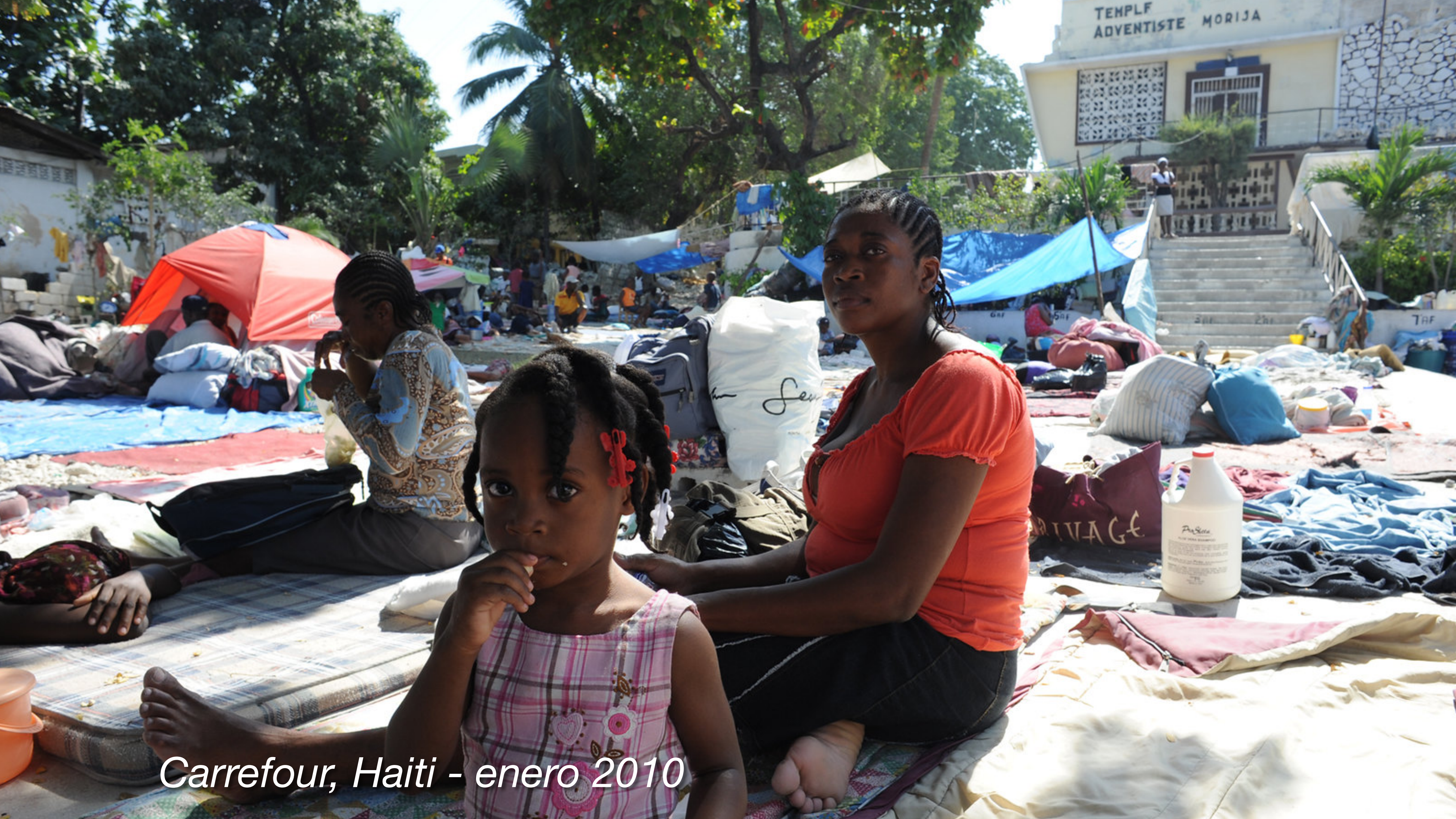
Carrefour, Haiti - enero 2010