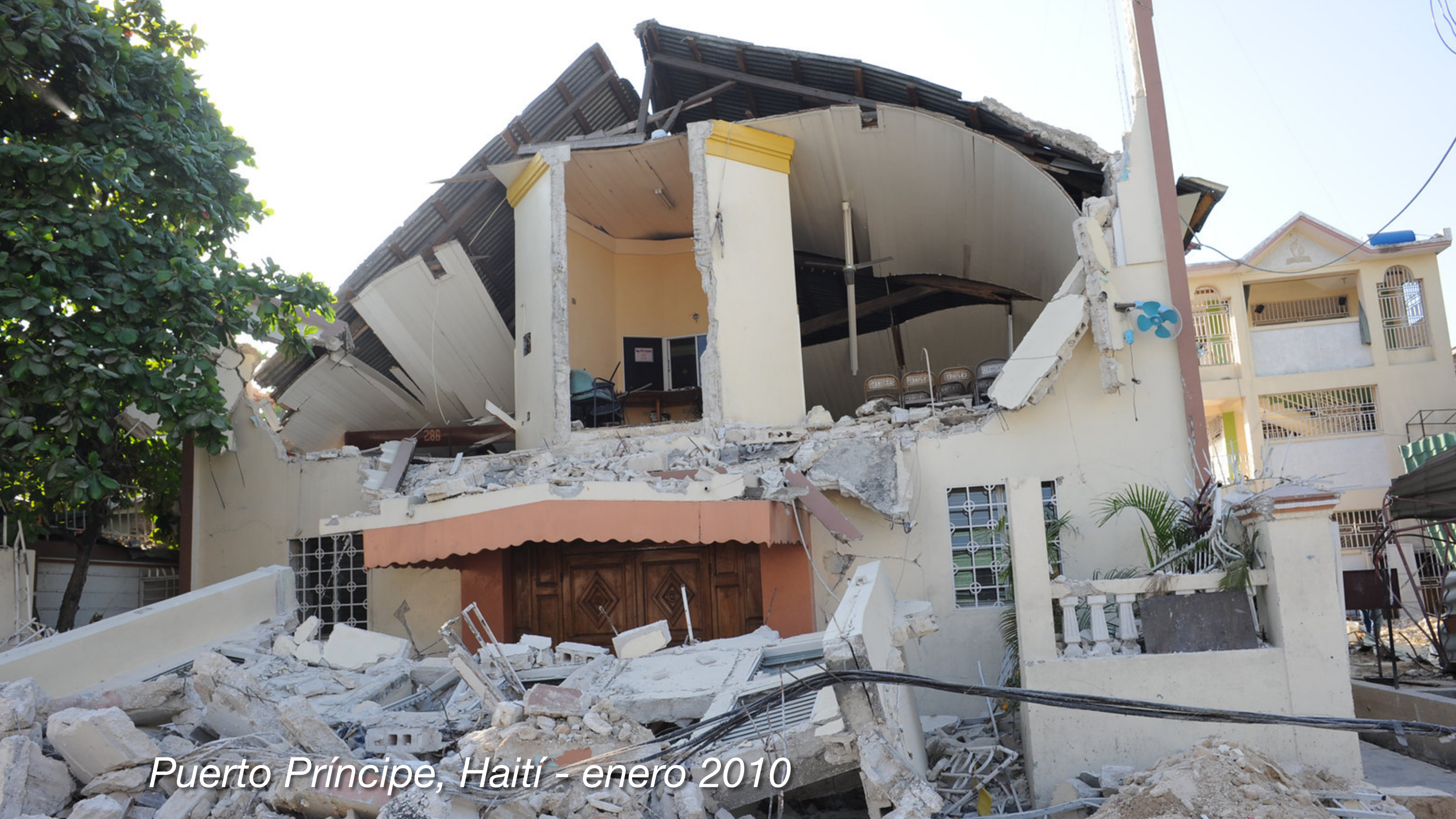
Puerto Príncipe, Haití - enero 2010