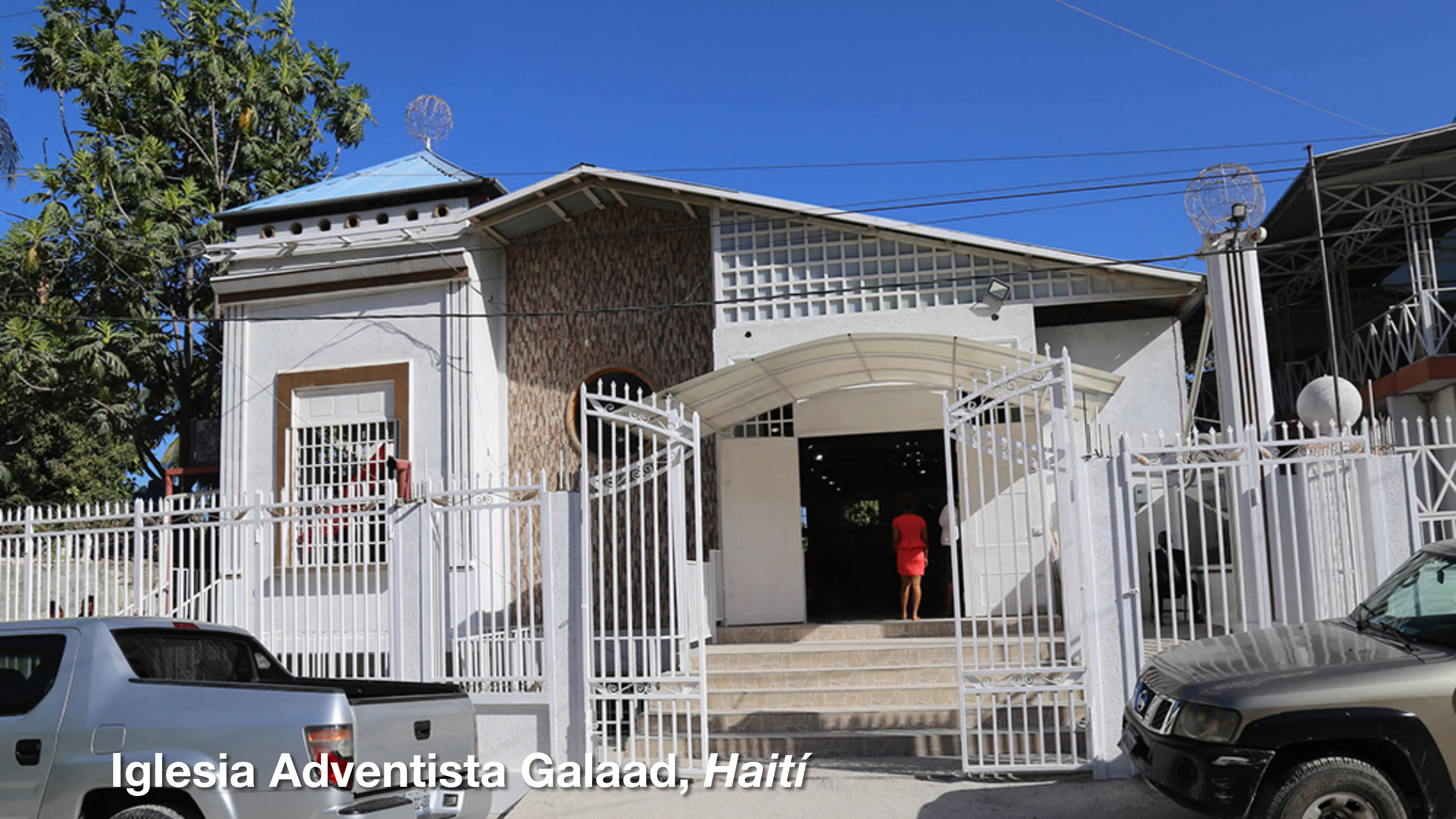
Iglesia Adventista Galaad, Haití