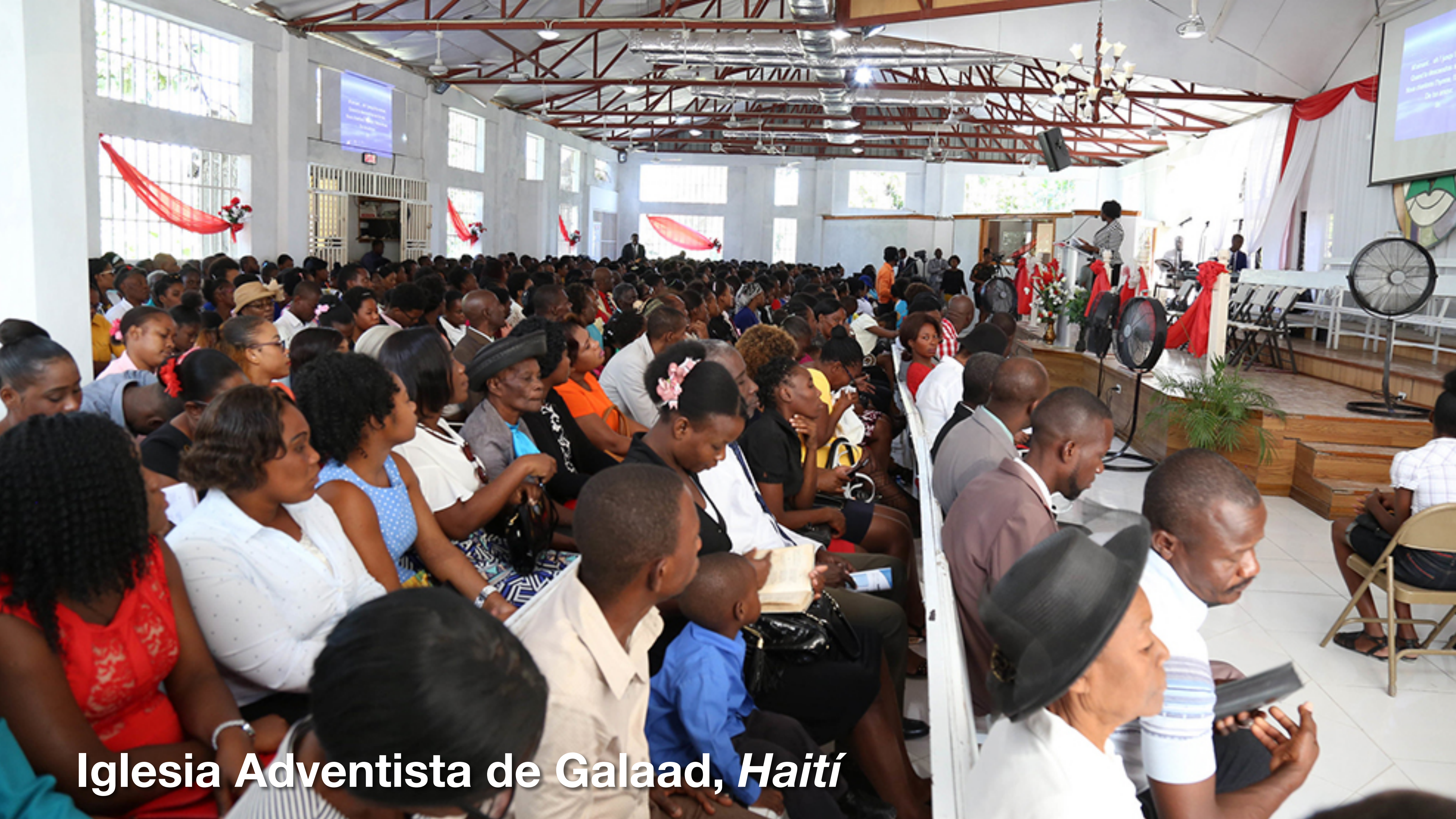
Iglesia Adventista de Galaad, Haití