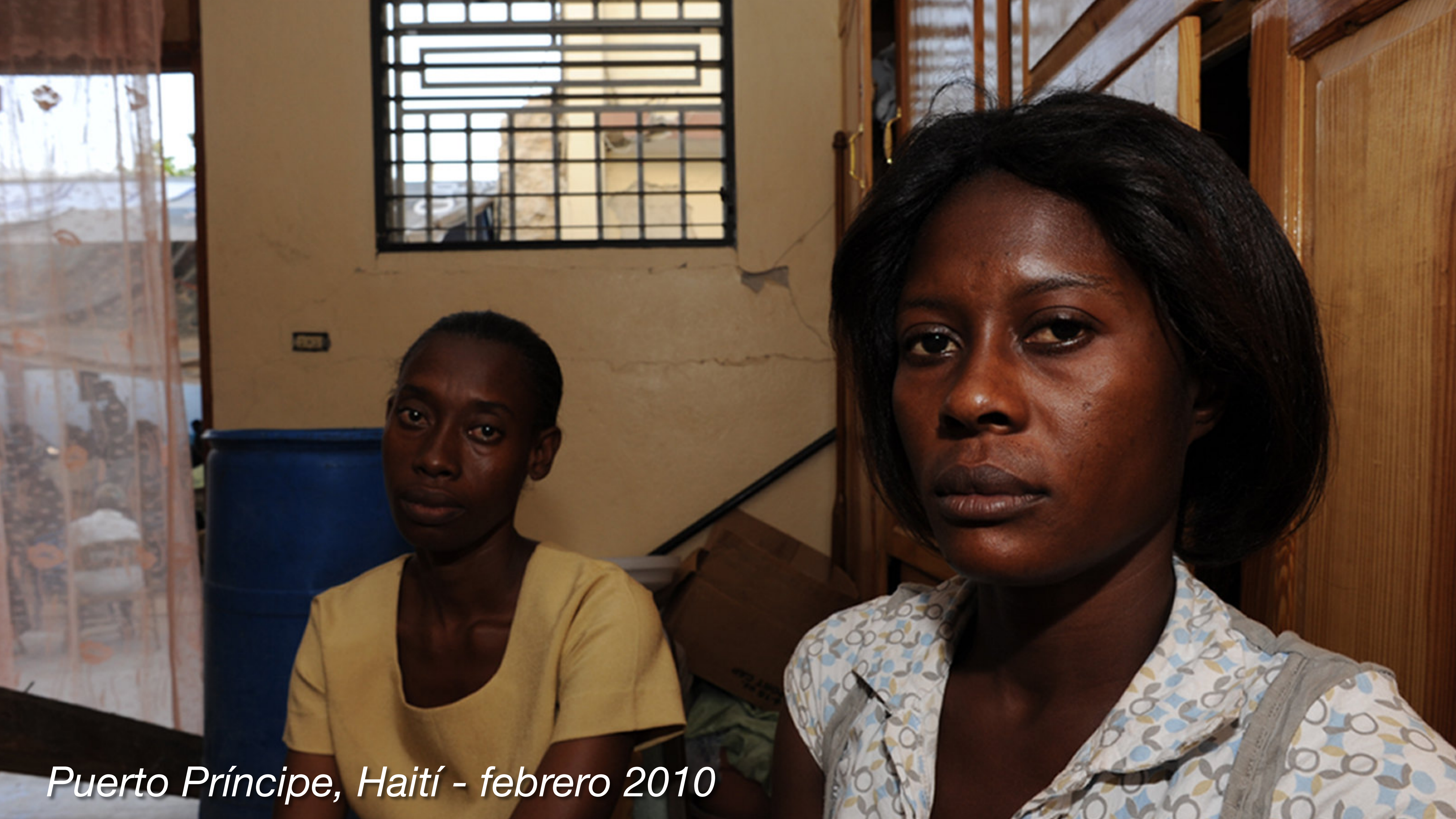
Puerto Príncipe, Haití - febrero 2010