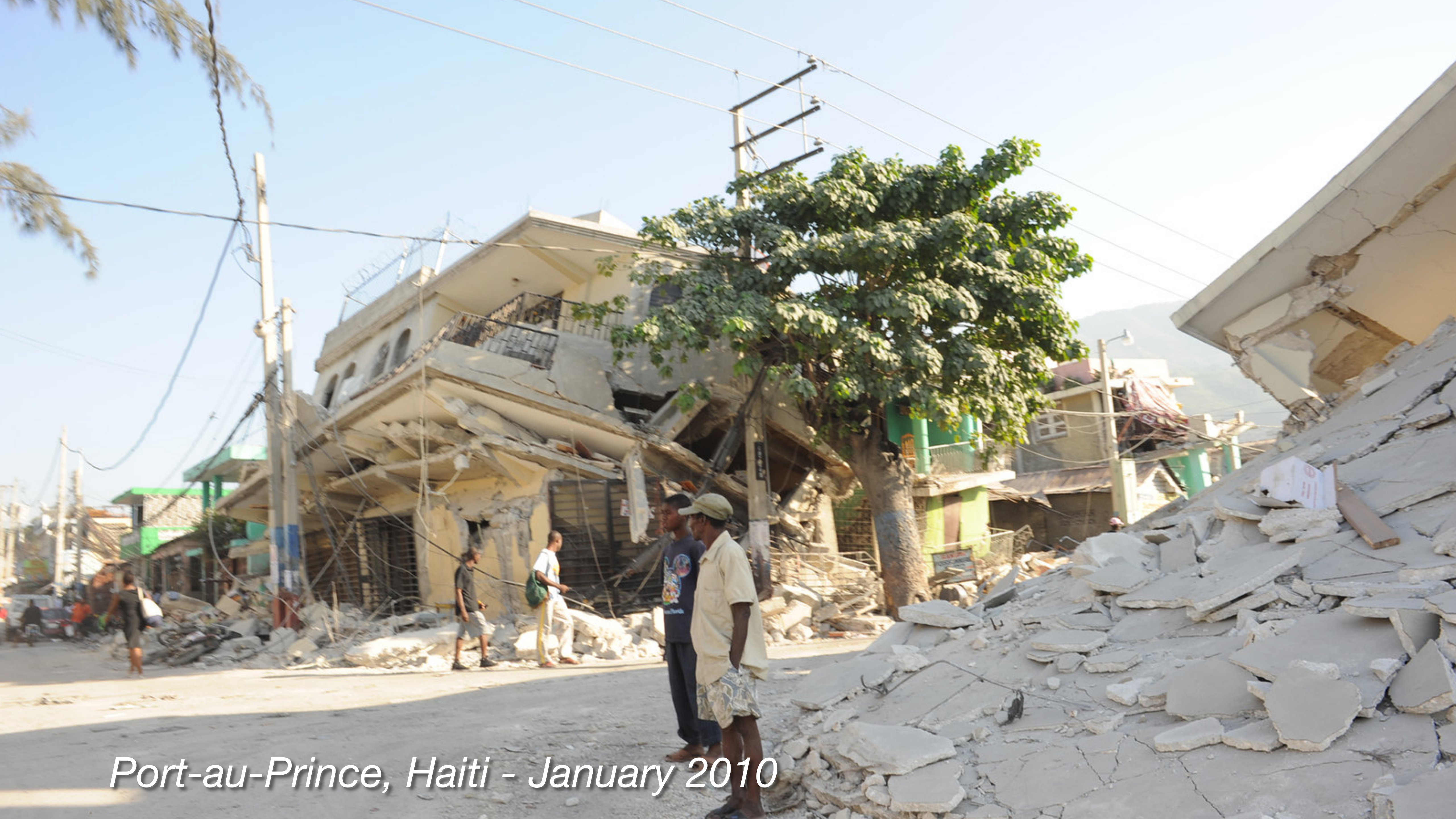
Port-au-Prince, Haiti - January 2010